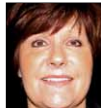
...and bring back a youthful look to the face.

Before and after hand courtesy of: Dr. Sydney Coleman Before and after face fat graft courtesy of: Dr. R. Craig Saunders