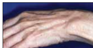
Stem cell rich fat can restore aged hands...